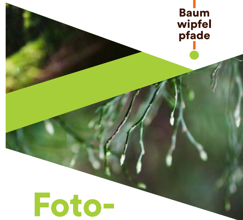
Foto- wettbewerb der Erlebnis Akademie AG